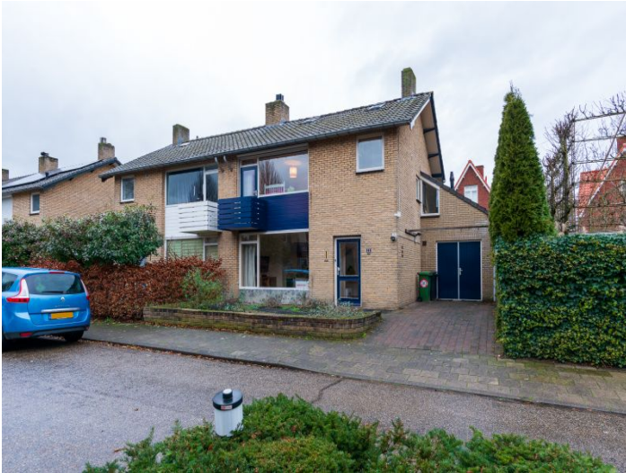
Vincent van Goghlaan 5581 JL Waalre Huurprijs per maand € 1.495,- excl.