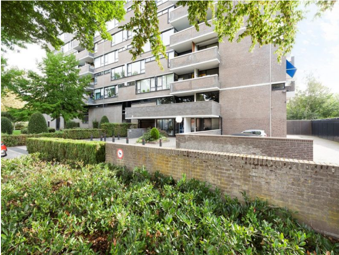
Korfakker 5625SP Eindhoven Huurprijs p/mnd € 1.390,- excl.