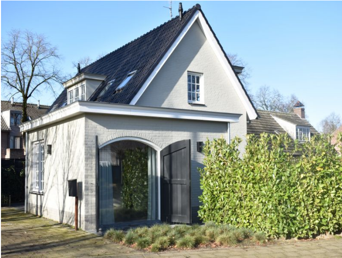
Joseph Schulteweg 5524 AZ Steensel Huurprijs per maand € 1.300,- excl.