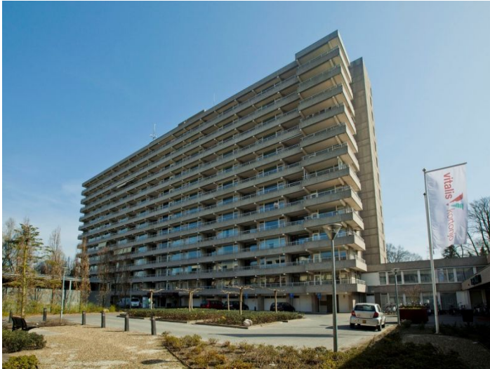
Herman Gorterlaan 5644SJ Eindhoven Huurprijs per maand € 550,- excl.